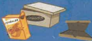
Boîtes - emballages carton