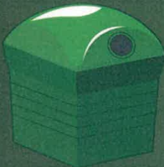
Cannettes en verre

A déposer vide, sans bouchon ni capsule, ni couvercle. Inutile de rincer le contenant.