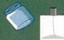
Bocaux et flacons