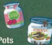
Pots en verre